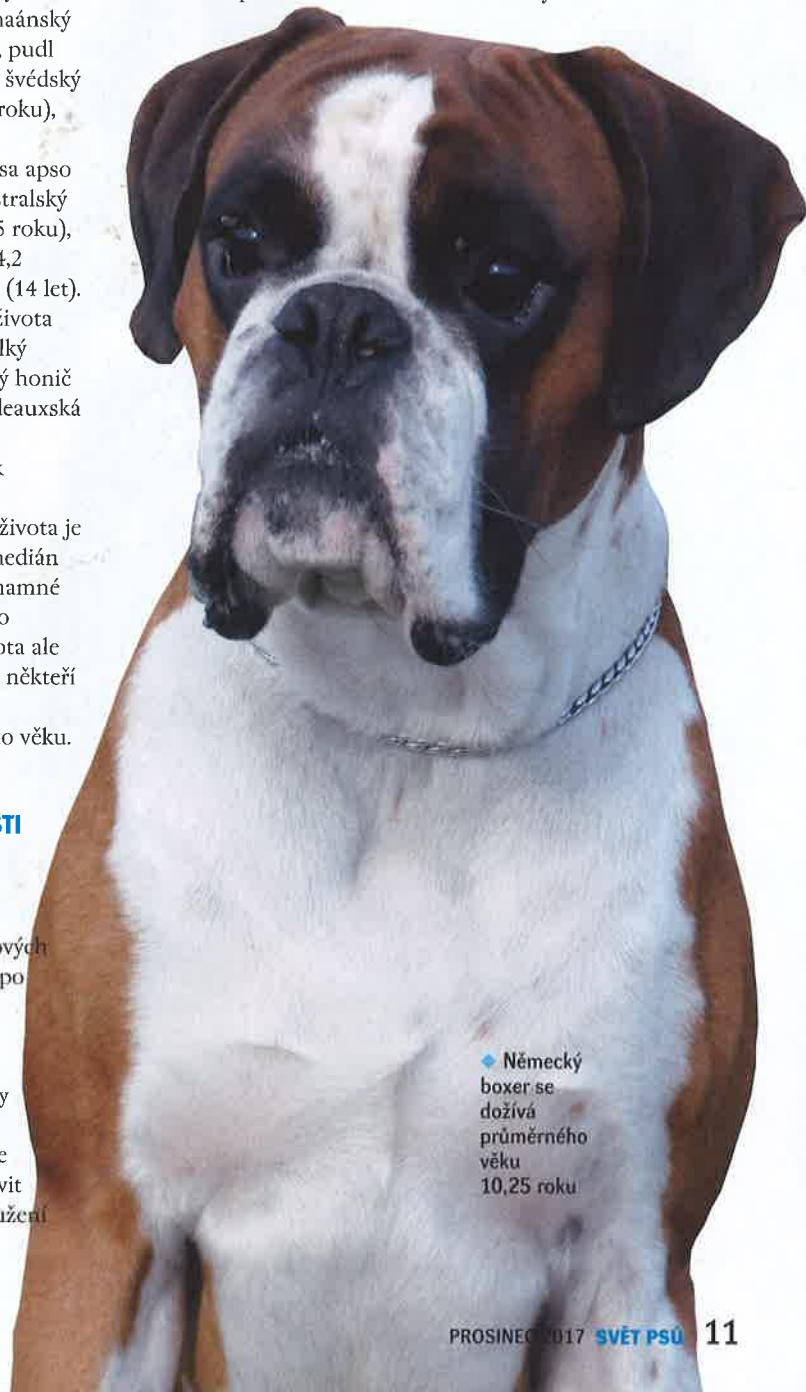
◆ Německý boxer se dožívá průměrného věku 10,25 roku

Dlouhověkost zvířat, stejně jako lidí, je geneticky determinována. Identifikace a analýza genů zodpovědných za dlouhověkost je velmi perspektivní cesta k dosažení dlouhověkosti jak u lidí, tak u zvířat. Některé geny související s dlouhověkostí již byly nalezeny u myši a u člověka. Zabýváme se studiem genů souvisejících s dlouhověkostí u plemene cane corso. V rámci našeho výzkumného programu spolupracujeme s cca 70 chovatelskými