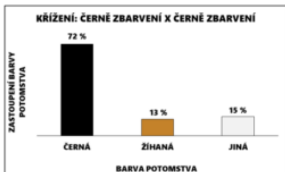
Obr.3: Zbarvení potomstva na základě zbarvení rodičů