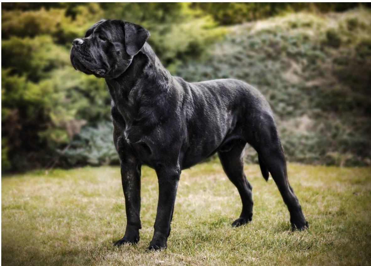
Obr.2: Aristocrat Korec Corso.