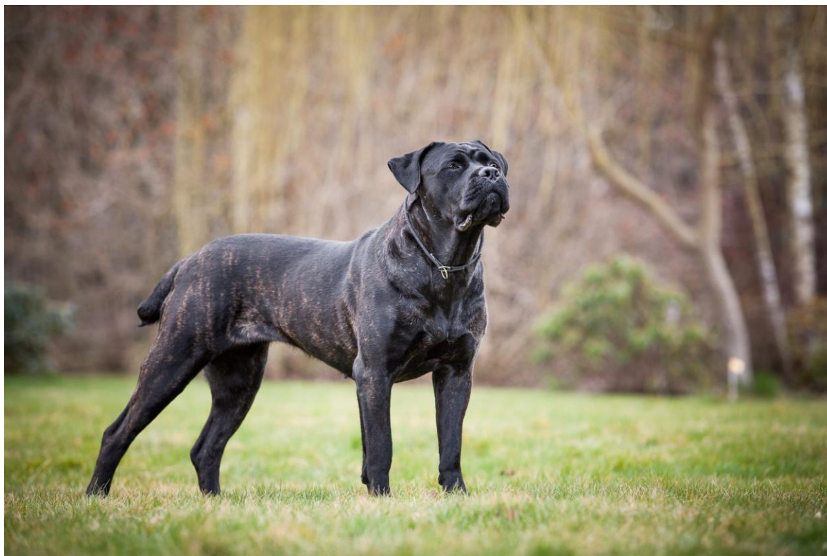
Fotografie psa plemene Cane Corso (Koleta Atison, archiv Evžena Korce)