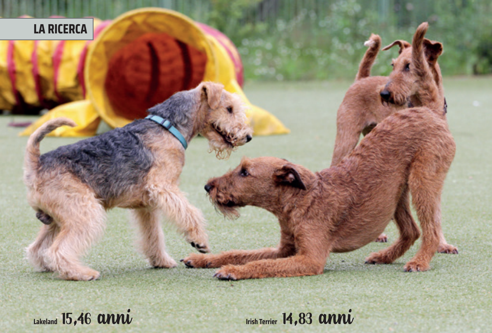
Lakeland 15,46 anni