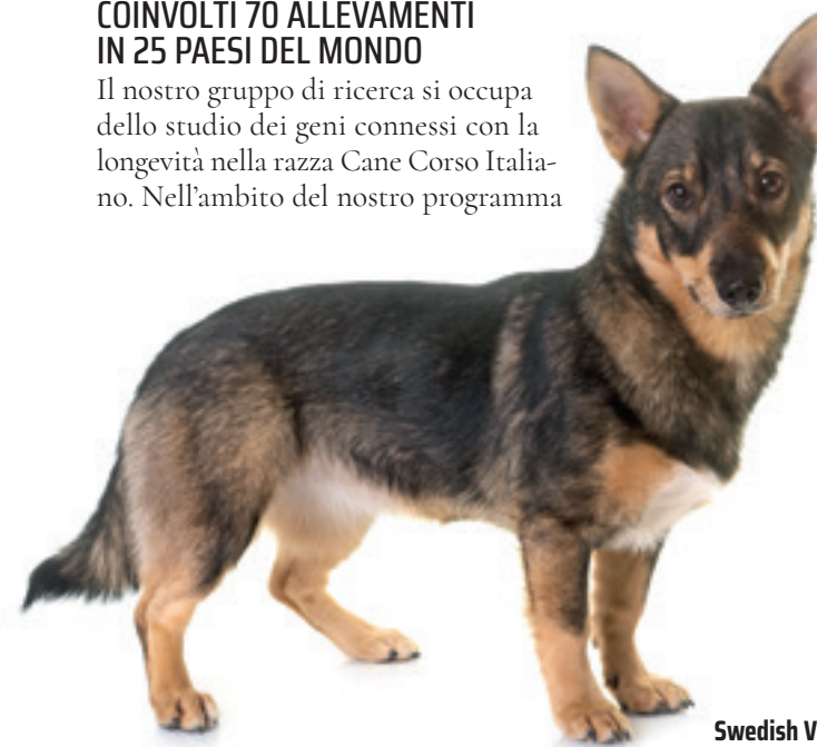
Swedish Vallhund 14,42 anni

Il nostro gruppo di ricerca si occupa dello studio dei geni connessi con la longevità nella razza Cane Corso Italiano. Nell'ambito del nostro programma