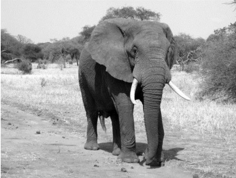
Slon se dožívá až 70 let.

Cestu k zásadnímu prodloužení života a téměř k nesmrtelnosti ukazuje proces přeměny diferencované buňky v buňku nádorovou. Pokud mají nádorové buňky v tkáňové struktuře zajištěn dostatečný přísun živin, jsou tyto buňky nesmrtelné. Molekulárně genetická podstata vzniku nádorové buňky je změna ve čtení genetické informace. Diferencovaná buňka přestává číst informaci odpovídající diferencované buňce, ale místo toho čte informaci odpovídající za dediferenciaci a rychlé dělení. Podobnou informaci četla buňka zárodku v době oplození vajíčka.