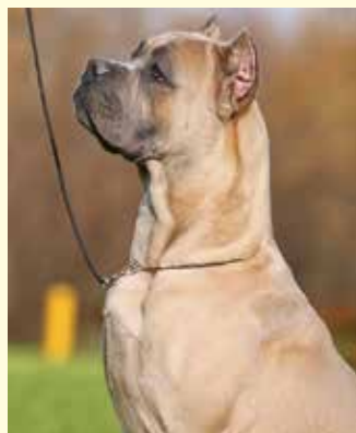
Форментино (палевый с голубой маской) Indiana Jones des Guardian du Pantheon

www.koreccorso.cz/en/longevity-research/ (+420) 233 372 021 director@zootabor.eu