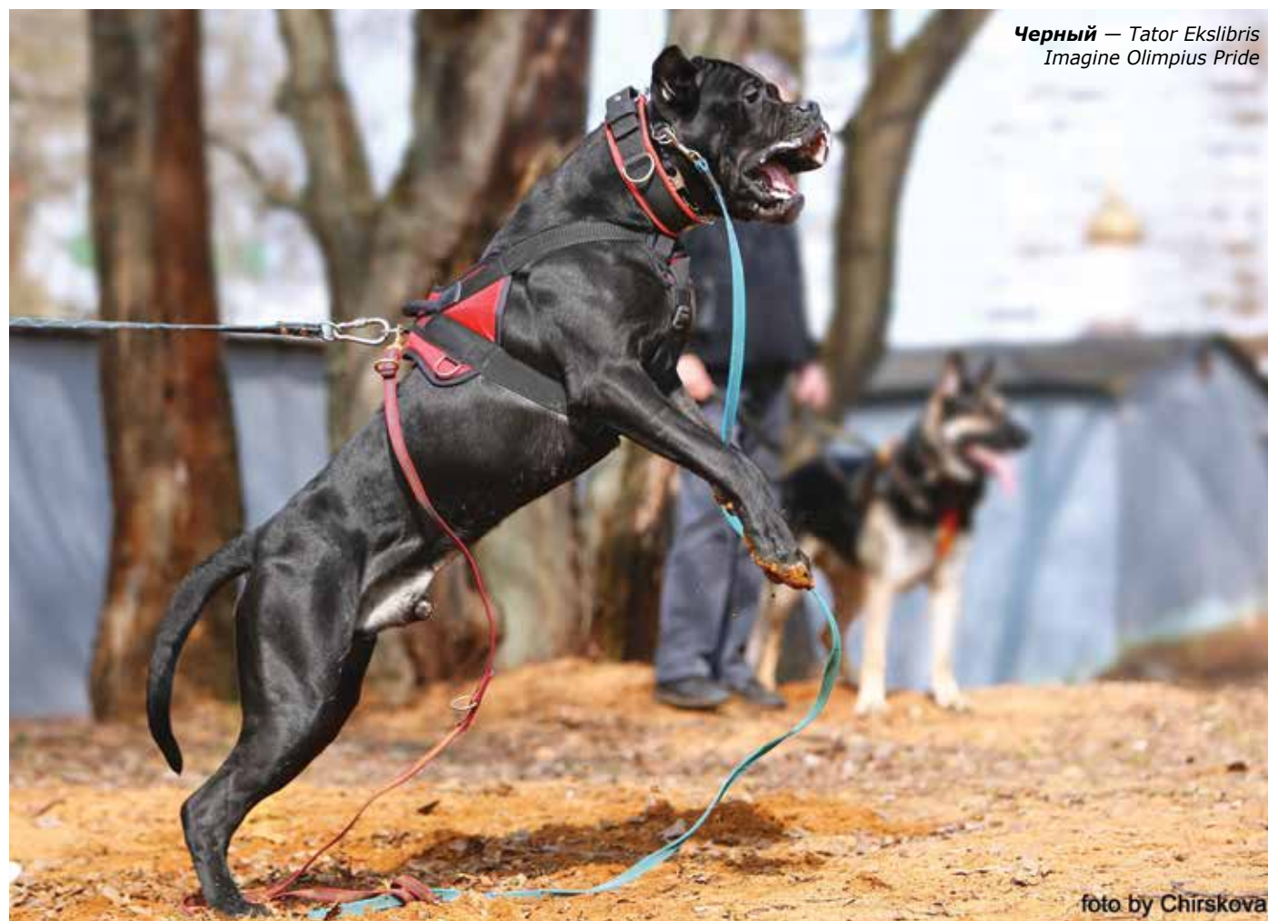
Черный — Tator Ekslibris Imagine Olimpius Pride