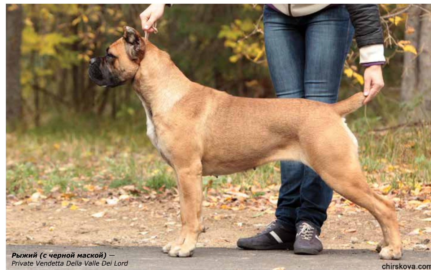
Рыжий (с черной маской) — Private Vendetta Della Valle Dei Lord