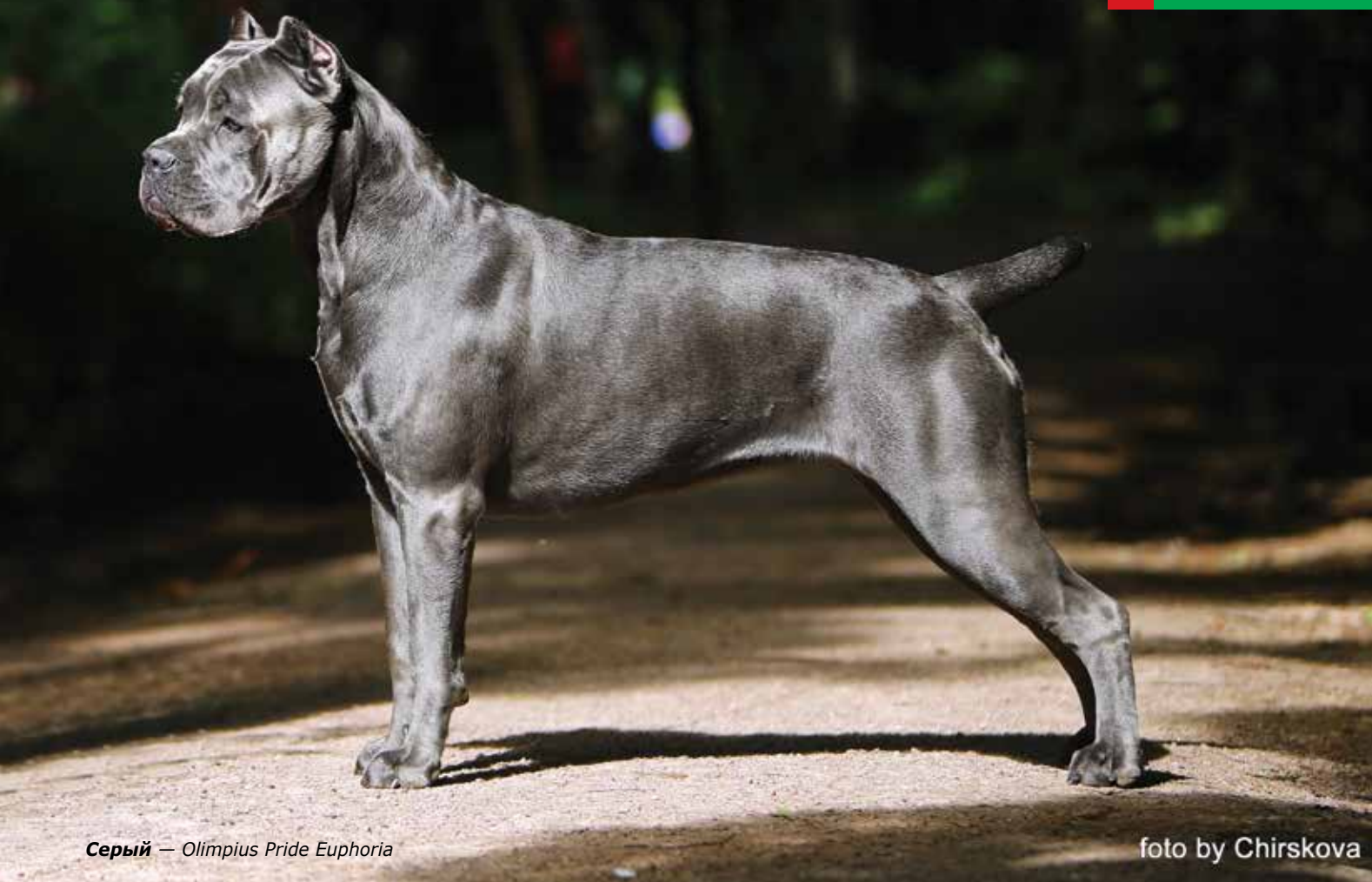
Серый — Olimpius Pride Euphoria