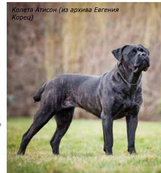
Колета Атисон

кане-корсо, которых и начали скрещивать. Первый стандарт породы был создан в 1987 году, когда было зарегистрировано 100 собак кане-корсо.