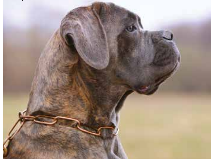
Серо-тигровый — Olimpius Pride Erika