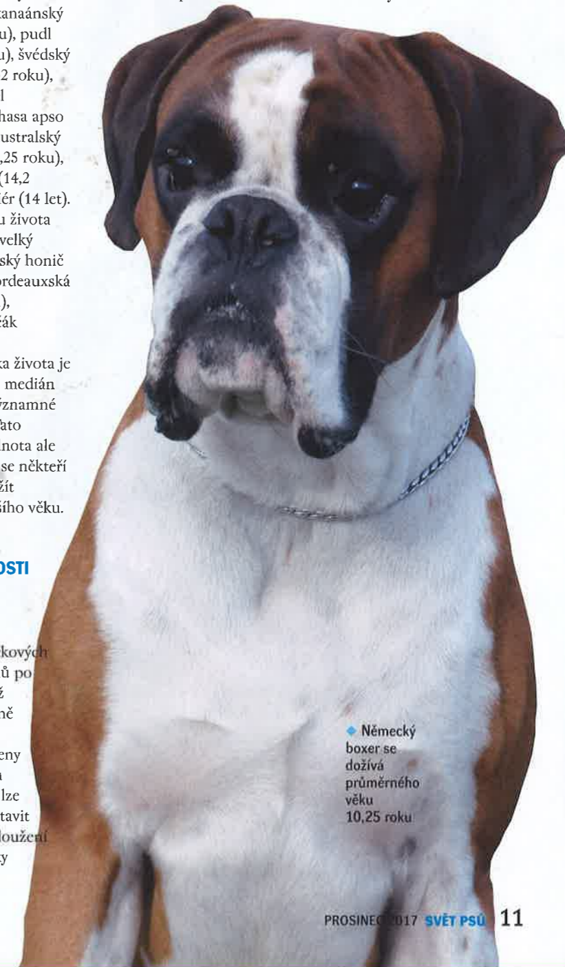
◆ Německý boxer se dožívá průměrného věku 10,25 roku

Dlouhověkost zvířat, stejně jako lidí, je geneticky determinována. Identifikace a analýza genů zodpovědných za dlouhověkost je velmi perspektivní cesta k dosažení dlouhověkosti jak u lidí, tak u zvířat. Některé geny související s dlouhověkostí již byly nalezeny u myši a u člověka. Zabýváme se studiem genů souvisejících s dlouhověkostí u plemene cane corso. V rámci našeho výzkumného programu spolupracujeme s cca 70 chovatelskými